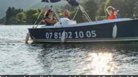
Naviguer en bateau électrique sur la Loire lorsqu'elle s'apaise à Auruc