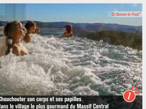
Chouchouter son corps et ses papilles dans le village le plus gourmand du Massif Central