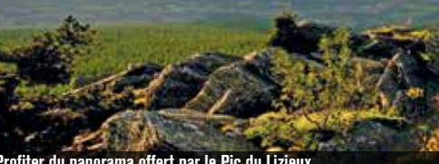
Profiter du panorama offert par le Pic du Lizieux