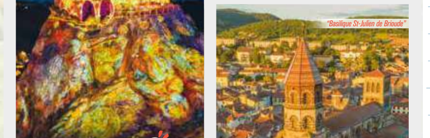
Être ébloui par le Puy-en-Velay haut lieu du spectacle numérique, capitale européenne des Chemins de Saint-Jacques-de-Compostelle, Patrimoine Mondial de l'Unesco