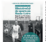
Archives départementales de la Haute-Loire